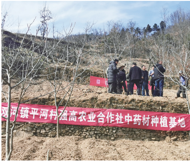
安康旬阳市农业局在双河镇平河村开展苍术中药材种植活动