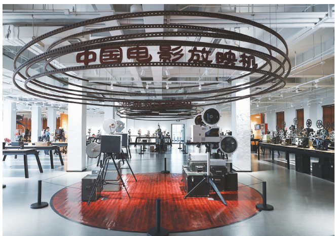
西影电影博物馆三层世界放映机馆