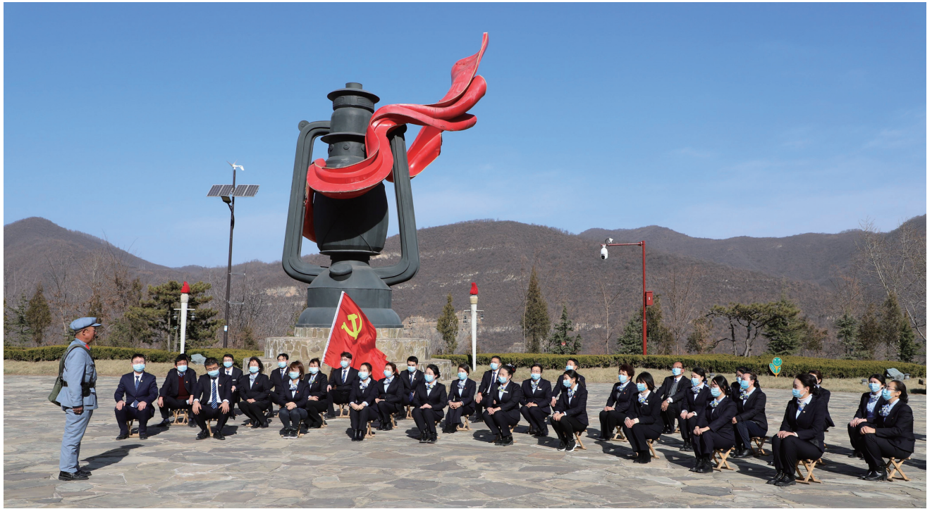
继承发扬照金精神是学习伟大建党精神的重要内容

中国共产党最根本的政治立场是人民立场，最大的政治优势是密切联系群众。“不忘初心、牢记使命”归根到底是不能忘了党全心全意为人民服务的根本宗旨。回顾照金苏区的历史，正是因为扎根群众、不负人民，陕甘边革命根据地才形成鱼水相依、血肉相连的党群关系、军民关系，筑起人民战争的铜墙铁壁。