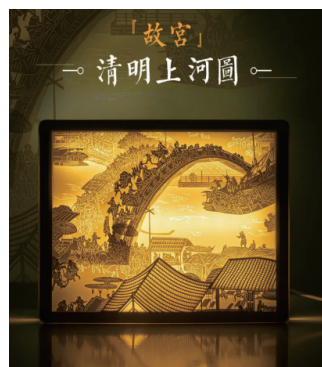
图1：清明上河图纸雕灯（来自故宫博物院文创旗舰店）

模仿其他已经形成的产品或产业模式，因此缺乏具有自身特色的差异化价值。4、机械流水线与手工艺品的错位竞争。手工艺品是匠人用汗血与时间交织的心血结晶，所需周期自然比较长，不少作坊为过于追求提高生产效率降低成本，使得许多粗制滥造的手工艺品出现在市场中，这样就导致传统工艺品缺乏工匠精神，手工艺的核心部分偷工减料，最终在经济利益驱使下，这种批量化、机械化的产品就会无意义地流入市场之中。