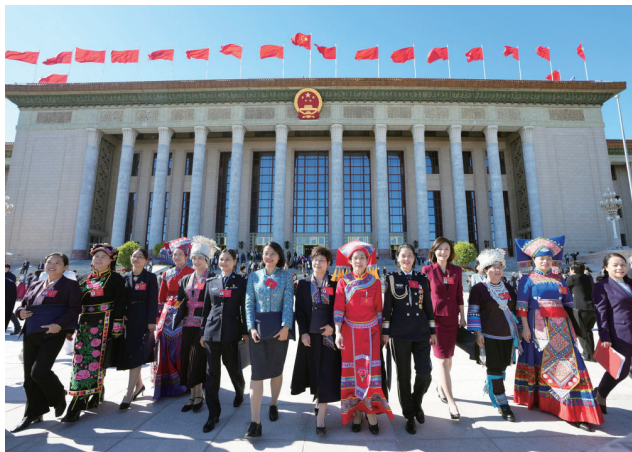
中国式现代化积极发展社会主义民主，强调发展人民民主必须始终坚持党的领导、人民当家作主、依法治国有机统一。

时，始终坚持稳定压倒一切的原则，加强政治安全和社会稳定的治理，使得中国政治环境保持着稳定。在此基础上，中国共产党秉持“人民当家作主”的原则致力于在推进改革开放的过程中逐渐推进民主化建设，把民主制度的改革和完善作为发展的重要方向，通过丰富人民的政治参与方式，积极探索适应中国国情的民主政治发展道路，实现了政治和谐稳定的良性发展，推动实现了现代化与民主二元建构的渐进性统一。