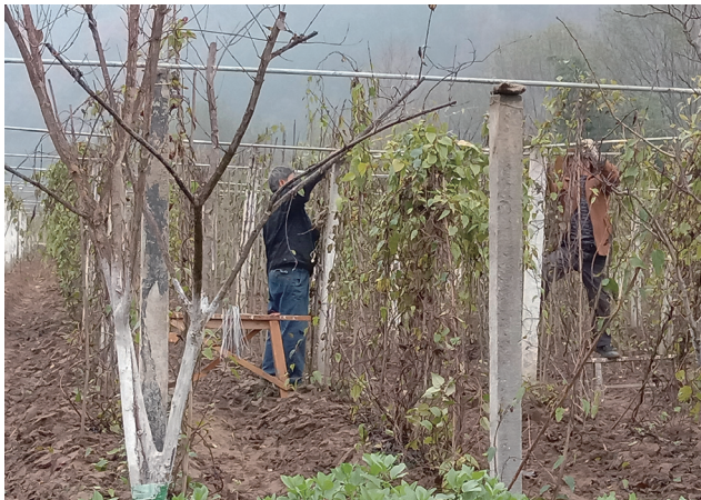
种植五味子和五味子成果

如今本草溪谷更多的时候被称为中医药康养小镇。当地政府对这个园区的定位是大力气发展秦巴山区中医药健康产业，加快推进中医药康养小镇与农旅融合建设步伐。因而从两河镇通往本草溪谷的不到10公里的旅游公路也非常通畅。