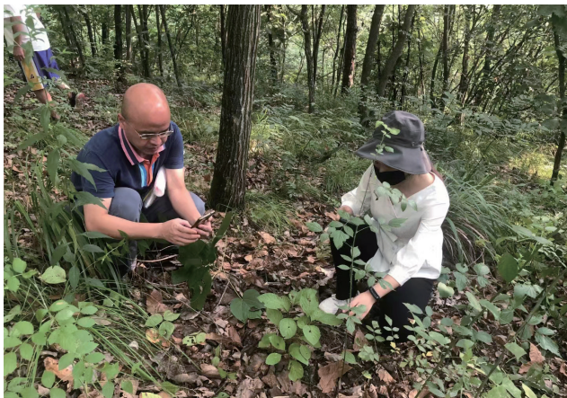
种植观测中医药苗