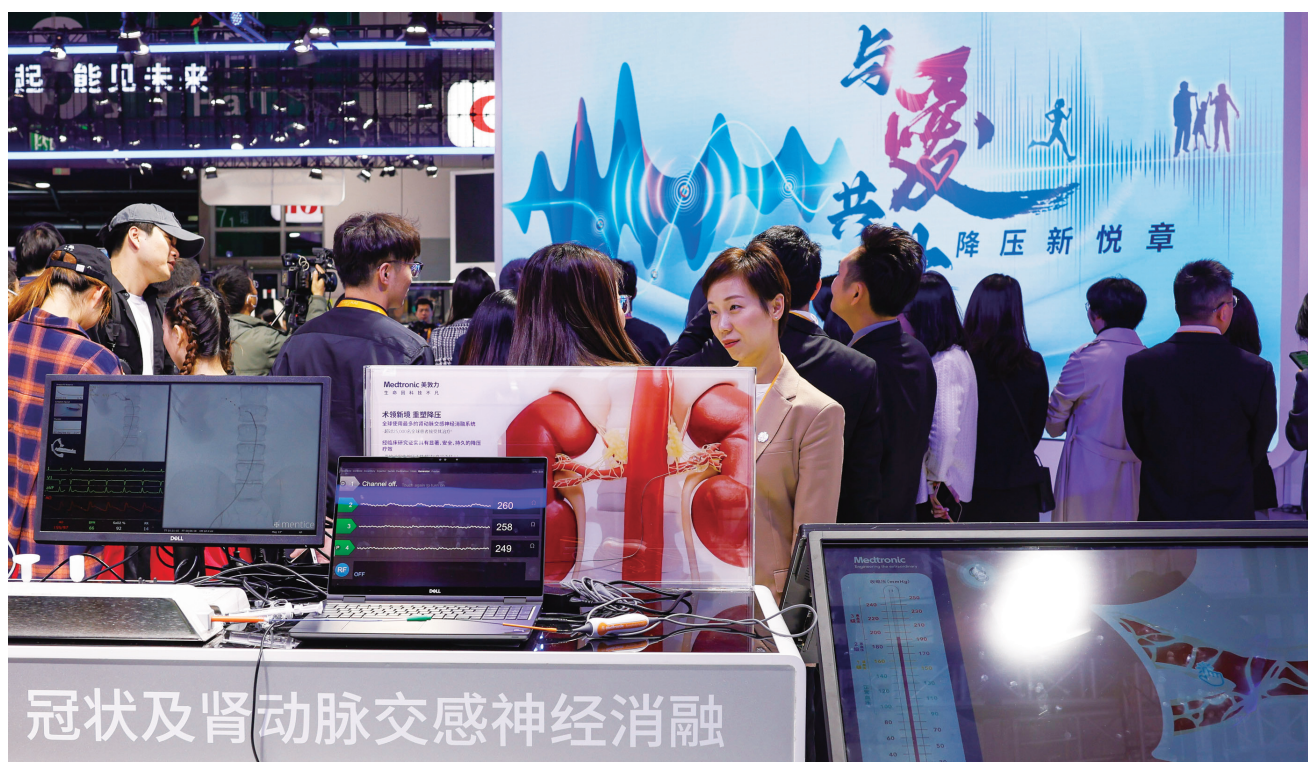
科技创新在医疗领域的应用，能够不断提升医疗技术水平，为大健康产业的高质量发展提供强有力的支撑。