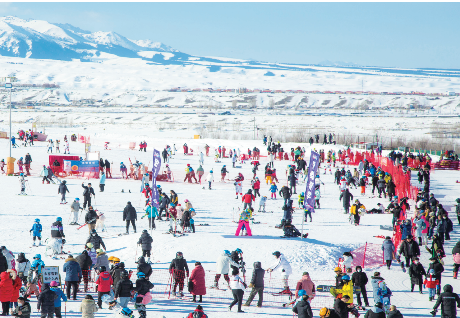
新一代新疆人过春节有了更多选择