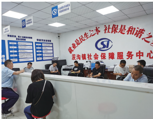
基层政府不只是农村公共服务的提供机构，还是主要的服务资源供应者。

传统公共服务建设过程中，缺少建立能够公开表达农民观点的机制，公共服务建设的推进难以得到民意支持。我国农村人口基数大、流动性强，空心化、老年化