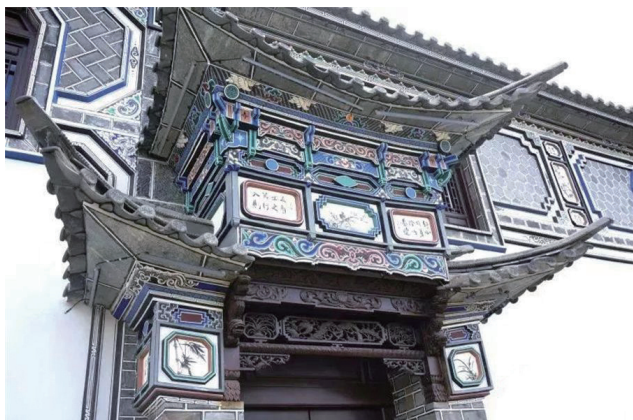
图3：白族建筑门楼部分的彩绘 (图片来源：大理州文旅局、大理州非物质文化遗产保护中心)

上，建筑本身白墙黛瓦，整体风格淡雅素净，一般在建筑的边缘小部分区域绘制精美的彩绘图案，整体留有大面积留白，图案本身颜色不甚浓烈，颇具水墨丹青的文人风格。色彩多冷色调，大多用黑白灰为基调辅以各种彩色，以墨色和素色为主，多水墨题材，但也可根据居民的不同需求与内容作不同调整。 [10] 在内容上，图案题材十分广泛，包括不同民族、不同文化、不同时代的内容。家家户户彩绘都是各具特色，包括儒家文化故事、宗教故事与流行的纹饰图样等。