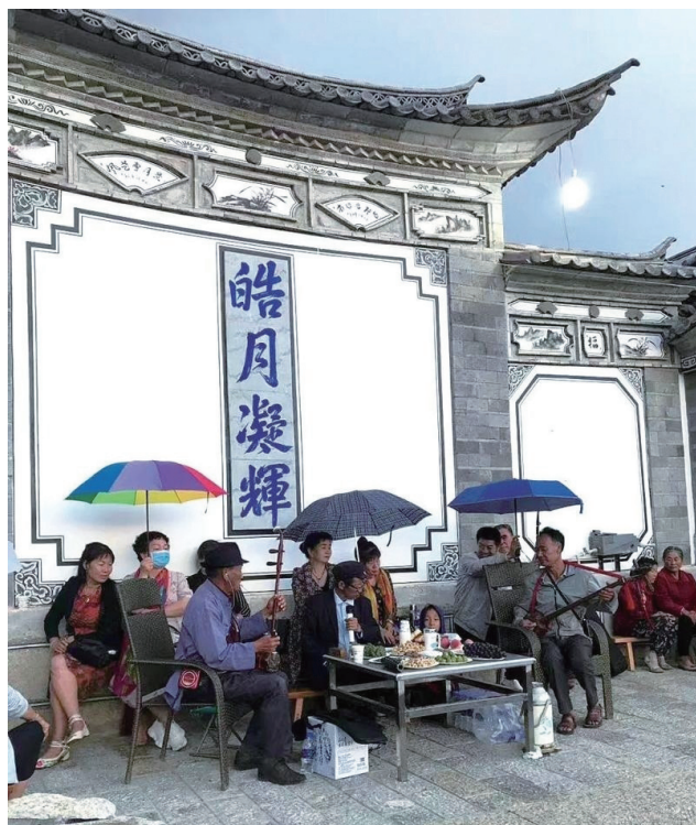
图5：写有宗族家风的白族传统民居

因指建筑彩绘的色调，类型包括蓝色系、绿色系、红色系、黄色系、黑白色系等。由于文化交融与时代变迁，各式各样的艺术风格在大理均有流传。大理白族建筑彩绘的风格基因包括油画写实类、国风水墨类、雕塑半立体类、平面装饰类等。从内在文化基因来看，大理白族建筑彩绘无论是题材还是风格都反映了白族注重居住环境的家屋文化。建筑彩绘文化内容主要是对家族繁盛的祈福，包括宗族家风、人文情趣、富贵荣华、知识教育、后代祈福、家宅平安等。对于白族人民而言，房屋不仅仅是居住之所，更是联系家族脉络，庇护子孙后代