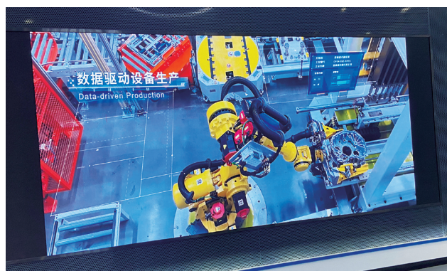
数据驱动设备生产全自动化