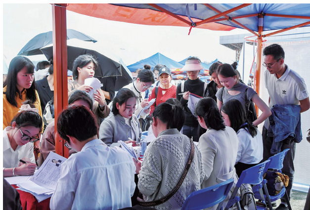
2024届广西高校困难毕业生群体就业帮扶双选会上毕业生投递简历

困难生需要面对贫困代际传递、家庭及个人资本积累等诸多挑战，既要解决家庭生存问题，又需要具备独立思考问题的能力，拓宽眼界与格局，洞悉个人优缺点，积极参与社会实习与实践活动。 [7] 大学生是推动“中国制造2025”的重要力量。大学生在校学习时不仅要掌握精尖技术，也要树立起端正的就业理念， [8] 凭借专业技